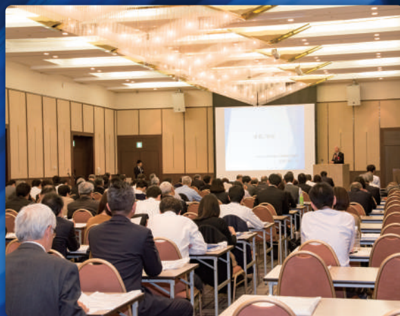
第6回シンポジウム(メルパルク京都)の様子

主催：大学改革推進フォーラム(株式会社NPCコーポレーション) 企画運営：大学問題研究所